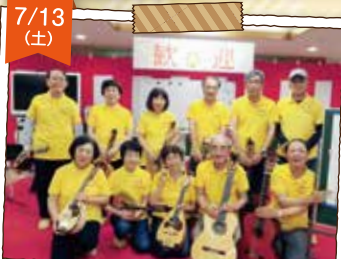
ファミリーギターサークルの皆様