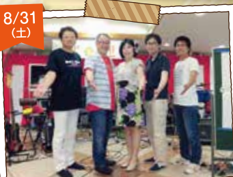
まるバンドの皆様