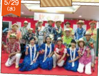
トロピカルズ&フラワ・リコの皆様