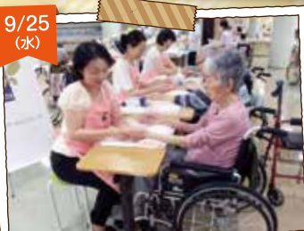
日本エステティック協会の皆様